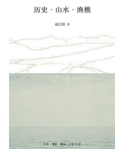
《历史·山水·渔樵》 赵汀阳 著 生活·读书·新知三联书店

本书以历史大变迁为背景，有效地呈现了“艺术”在不同文化语境中的具体含义，并以各种艺术风格的形成、发展为线索，全面解析了4500年来印度审美风尚的历时性嬗变。此外，针对21世纪的艺术应如何在尊重传统文化遗产与建立现代艺术之间取得平衡的问题，作者在层层递进的论述中巧妙地给予了回应和解答。全书近300幅精心挑选的彩色插图堪为一场奇妙的视觉盛宴。