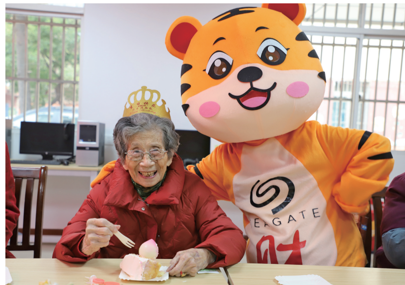
新春来临之际,黄巷社区组织志愿者为辖区的百岁老人祝寿。