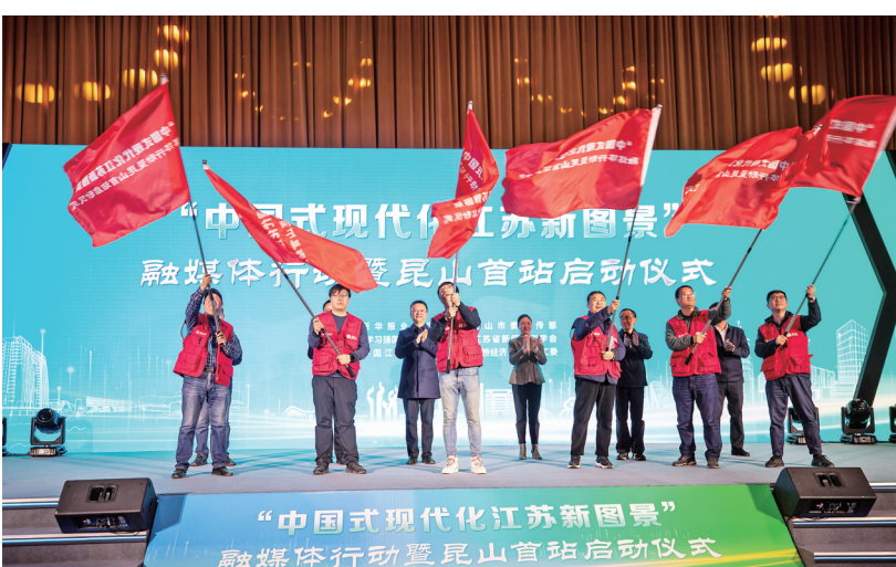
昨天下午,“中国式现代化江苏新图景”融媒体体行动暨昆山首站启动仪式在昆山国际会议中心举行,来自全省30多家主流媒体参与此项活动。记者将走进城乡社区、田间地头、企业园区、高等院校等基层一线,用镜头记录推进中国式现代化的新实践,全景式呈现出正在江苏大地上徐徐展开的一幅幅奋进新征程、阔步现代化的壮丽图景。图为当天启动仪式现场。

陈冬、刘洋、蔡旭哲同志是不忘初心、牢记使命、献身崇高事业的时代先锋,是探索宇宙、筑梦太空、建设航天强国的标兵模范。党中央号召,全党全军全国各族人民要以习近平新时代中国特色社会主义思想为指导,全面学习、全面把握、全面落实党的二十大精神,以受到褒奖的航天员为榜样,紧密团结在以习近平同志为核心的党中央周围,深刻领悟“两个确立”的决定性意义,增强“四个意识”、坚定“四个自信”、做到“两个维护”,坚定信心、同心同德,埋头苦干、奋勇前进,大力弘扬“两弹一星”精神和载人航天精神,为全面建设社会主义现代化国家、全面推进中华民族伟大复兴作出新贡献!