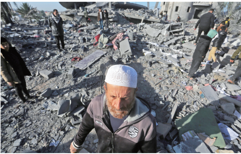
12月22日，在加沙地带南部城市拉法，人们查看以军空袭后的废墟。以色列军方22日宣布，在加沙地带南部的拉法市部分区域实行“人道主义暂停”。

捷克警方22日说，首都布拉格查理大学枪击事件中的14名遇难者身份都已确认，没有外籍人士。（据新华社稿）