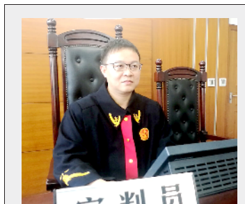
主审法官： 吴坚，锡山区法院安镇法庭

院不予支持。经法院调解，小汪的父母自愿放弃要求对方支付该笔赔偿款主张。（王亦华）