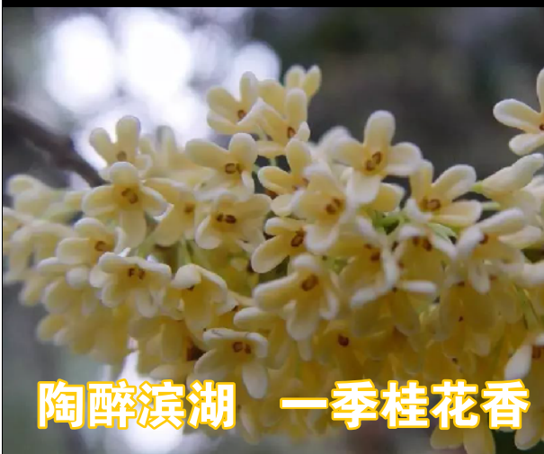
陶醉滨湖 一季桂花香