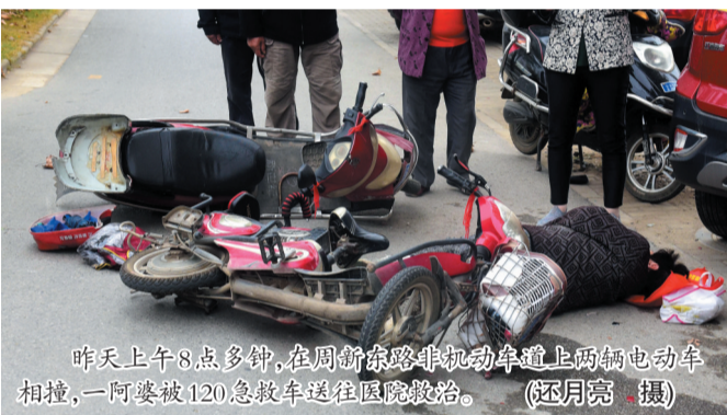
昨天上午8点多钟,在周新东路非机动车道上两辆电动车相撞,一阿婆被120急救车送往医院救治。