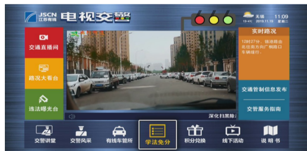
广电高清互动机顶盒在直播节目按“666”进入

去年12月2日，“电视交警”平台一期亮相锡城，创新性地实现家庭侧交管业务办理、交通安全普适性教育两大功能，“看电视交警，免违法记分”深入人心；今年6月，平台二期改版升级，违法曝光台、学法免分新规两大功能全新亮相，引爆锡城。“单次最高免六分、一个记分周期最多免十分”，“电视交警”成为交管新规独家试点平台。电视交警综合服务平台上线一年来，访问数近百万次，电视端学法免分近3万笔，“电视交警”已经成为无锡交管新名片。