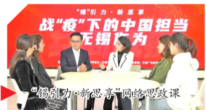
“锡引力·新思享”网络思政课

落实上形成上下共识,同时,建立市级重大主题宣传策划、中央及省级网媒项目合作、重大活动联动报道、商业平台自媒体大V交流分享等机制,把讲政治、讲导向,贯穿到报、网、端、微、屏各媒体。目前,两市五区均已挂牌成立融媒体中心,形成内外交融、一体协同、共享共推的基层融媒体矩阵,为打通党的声音全域传播“最后一公里”提供主渠道。