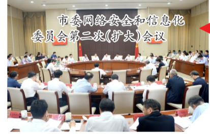
市委网络安全和信息化委员会第三次(扩大)会议

上主题宣传总传播量突破30亿次;“风雅颂”“赋比兴”两届短视频大赛产出原创短视频500余部,作品点击量近4000万次;连续举办8届网络文化季活动,2019年百场快闪活动荣获省优秀项目奖,167部精品作品总传播量突破1.5亿次,有效激发了网民向上向善力量。