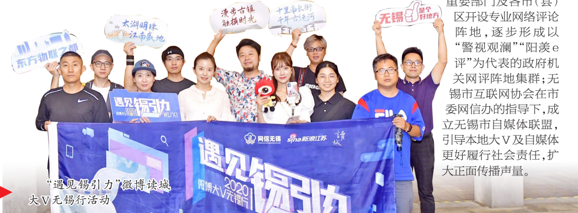
“遇见锡引力”微博读城大V无锡行活动