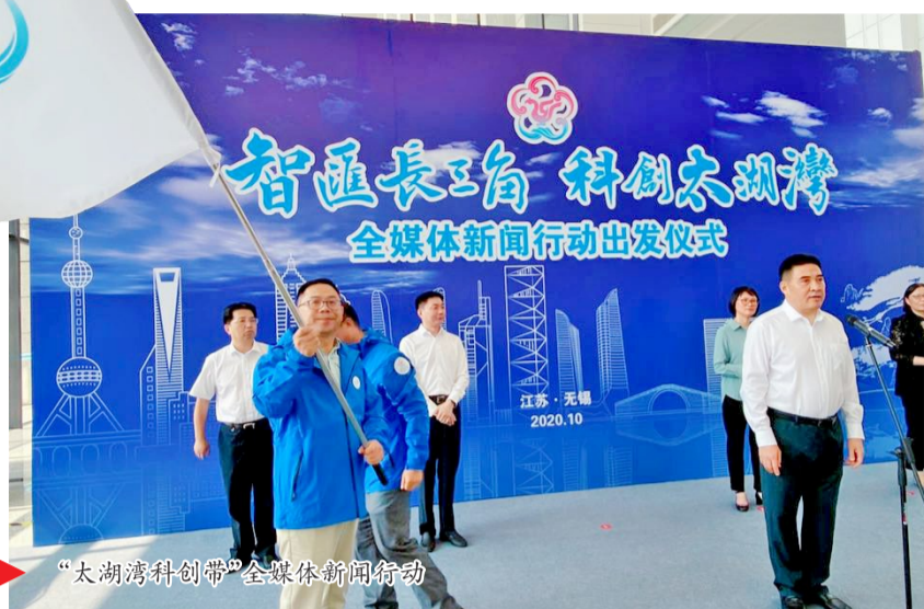
“太湖湾科创带”全媒体新闻行动

今天,2020长三角·紫金网络传播创新峰会在无锡拈花湾举行。本次峰会是长三角地区网信部门深入学习贯彻党的十九届五中全会精神的重要会议,也是长三角地区网络传播领域的一次盛会。作为本届峰会的“东道主”,无锡高度重视网络传播工作,把“传递正能量”放到网络传播工作的首要位置,自觉承担起新时代网络传播工作的使命任务,以网络传播为主体、网络管理为重点,为建设“强富美高”新无锡、当好全省高质量发展领跑者,营造了浓厚网络舆论氛围。