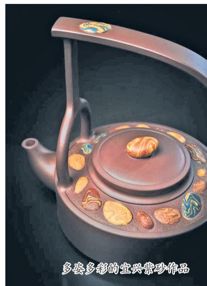
多姿多彩的宜兴紫砂作品