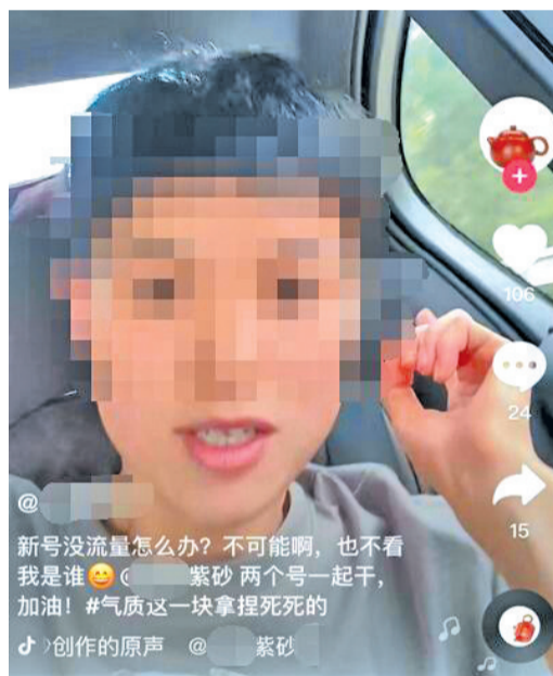
被封禁的抖音直播账号

9月23日,抖音电商直播宜兴基地的通告称:经查,抖音账号“菜×直播”“A季××雾器”等主播在6月27日晚直播时宣称“全丁山没有做手工壶的人”等言论,其言论虚假夸大宣传,严重误导消费者,诋毁紫砂行业,引起紫砂从业者的极大愤慨。该事件的持续发酵,引起了政府、市场监督管理局、行业协会、抖音基地的高度重视。根据抖音平台管理规范,《紫砂直播行业公约》等规则,报请抖音平台给予“菜×直播”“A季××雾器”等账号永久封号清退处理,并不再接受该责任人相关账号入驻抖音平台。