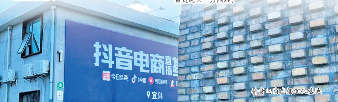
抖音电商直播宜兴基地

宜兴经典陶坊段卉表示,紫砂的基础泥色有三种,即紫泥、红泥和本山绿泥。但为什么能烧出这么多颜色的紫砂器呢?其实,原矿泥料里本来就存在着多彩多色的紫砂,就算是单一基色的泥矿,不同的矿区或地理位置所含矿物质的比例也不尽相同,颜色会有一定的差异,再说三种泥色的基泥相互调配也可以出现多种不同的颜色。