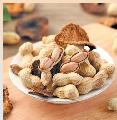
陈皮花生 传统古法制作 柑香浓郁 可口香脆 陈皮可泡水 313g/袋 小晚价：1袋装 19.9元 3袋装 39.8元 6袋装 79.6元