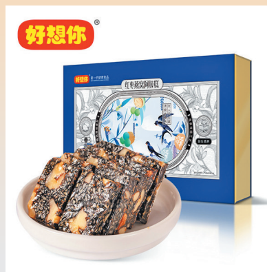
好想你红枣燕窝阿胶糕 300g 小晚价：258元