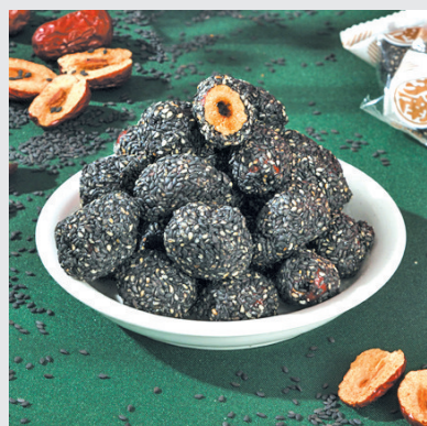
黑芝麻脆枣 酥脆鲜香 能量满满 一口嘎嘣脆 小晚价：1盒装 29.9元 3盒装 59.9元 5盒装 89.9元