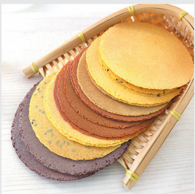
五谷粗粮薄饼 酥脆可口 不添加蔗糖 营养代餐小零食 小晚价：1盒装 19.9元 3盒装 39.8元