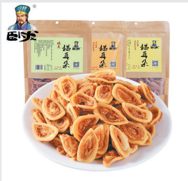
卧龙猫耳朵零食 280g*3袋 怀旧猫耳酥 甜辣/五香口味 小晚价：29.9元