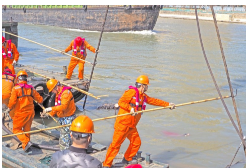
救援队队长亲自下场作业,带领年轻队员穿引钢缆,河面起伏不定水上作业难度颇高。