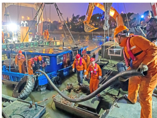
船尾顺利吊出水面,救援队员立刻接入数个水泵给船尾舱和货舱排水,利用浮力尽量托起船身。