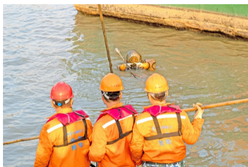
潜水员穿着数十斤的潜水装备潜至船底固定钢缆,附近小船上的队员随时准备接应。