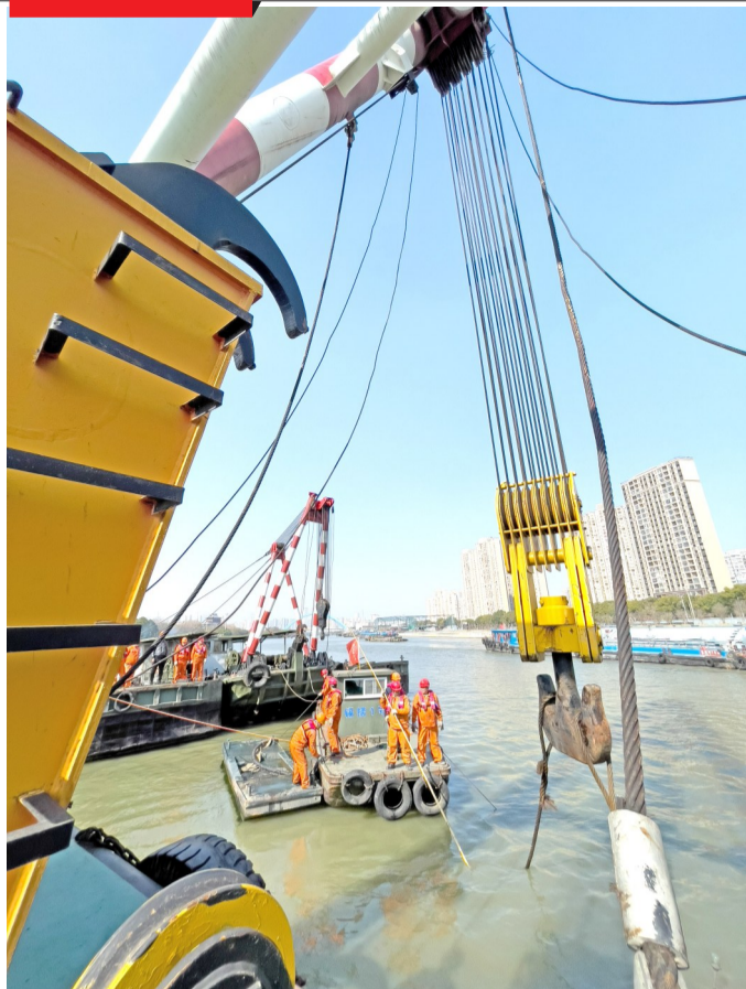
2月19日晚,一艘货船在京杭大运河无锡段遇险沉没。无锡市交通综合执法局连夜赶赴现场组织救援。在连夜过驳转移货物后救援行动于20日白天展开。