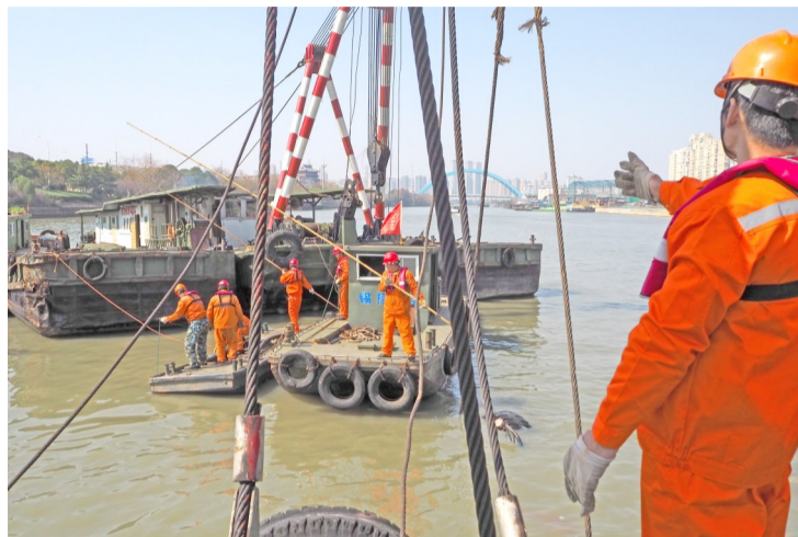
救援队员正在固定船尾钢缆,一艘500吨的货船需要穿引数条钢缆承重,保证船体不发生断裂。