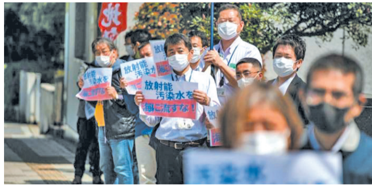
东京首相府外,民众集会抗议政府计划将福岛核电站核废水排放入海。(资料图)