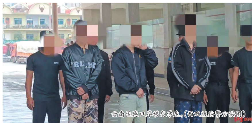
云南孟连口岸移交学生。