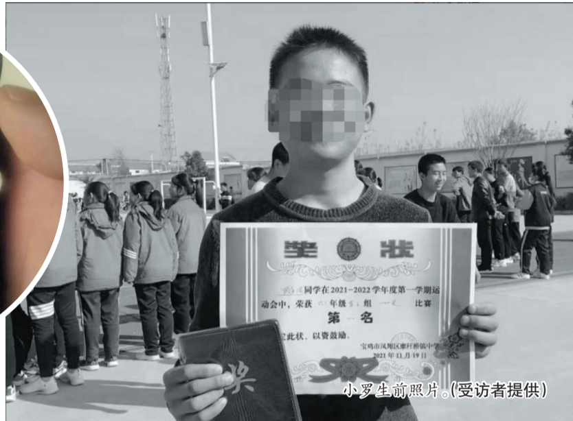
小罗生前照片。