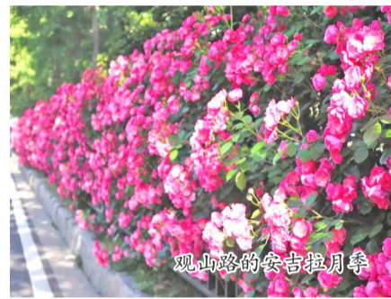
观山路的安吉拉月季