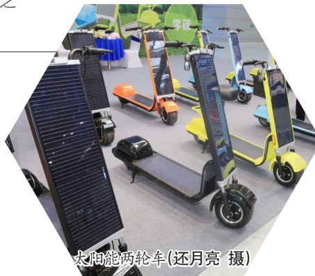
太阳能两轮车(还月亮 摄)

前面配备了一块光伏板,可通过光伏发电为车身内置电池充电,充满电后预计可行驶35公里。“两轮车在今年5月正式启动B端销售,主要面向欧美、非洲等国外市场,已销售了2万多台。下一步,我们会面向国内市场进行销售,让‘双碳’理念深入大家的生活。”(晚报记者 孙晔)