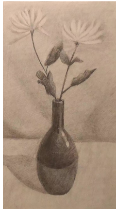
梅村实验小学四(10)班 沈语馨 瓶中花