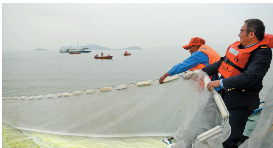
昨天,工作人员在太湖水面拉围隔。当天,鼋头渚风景区管理处举行安全度夏应急演练。

随着汛期天气的开启,接下来我们也要做好准备接受各种突发复杂天气的“考验”,其中最重量级的“访客”就是梅雨。据气象部门人士介绍,5月底到6月上旬,暖湿气流更加活跃,潮湿闷热的天气会越来越多,这意味着一年一度的梅雨天气形势在逐渐酝酿中。对于江南地区来说,6月将是一年当中降水量最大的时节,无锡也将会进入一年中降雨最为集中的梅汛期。