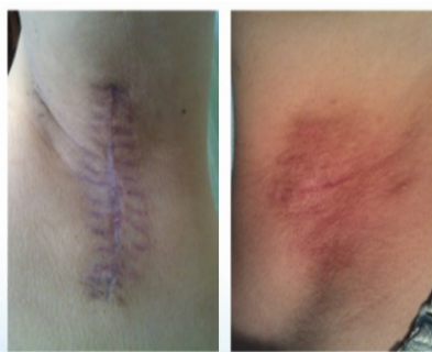
传统手术后 微创手术后

腋臭手术方法包括传统手术和微创手术。传统切除术是将腋下腋毛的皮肤及皮下组织整个切除,但因为腋毛边缘一公分之内尚有汗腺残留,导致异味不能根除,且切口较大