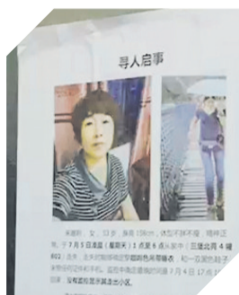
小区电梯里 粘贴的寻人启事。