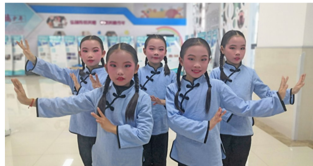
2019年第十二届无锡市新市民学校(子女)才艺展示 锡剧

自2017年起,立人小学的舞蹈、合唱、管乐在无锡市、滨湖区少年宫组织的中小学艺术展演中屡获金奖;校鼓号队连续两届获无锡市鼓号大赛金号奖。此外,在市、区少年宫组织的中小学生才艺比赛中有10多人获一等奖,区级以上书画比赛获奖100多人。除积极参加区市级各类竞赛演出外,学校还精心策划校园文化艺术节、新年音乐会、班级特色阵地等特色活动,让艺术爱好者体验学习、成长之乐,鼓励艺术特长生积极参加学校立雅管乐团、滨湖区青少年交响乐团排练、演出,让“立宝”登上更高的舞台,见识更广阔的世界。