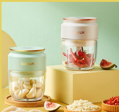
【Bokuk 伯可福多功能切碎机】 绞肉/蒜泥/辅食/酱料 加厚玻璃杯身 小晚价：梨花白/松石绿 75元/台