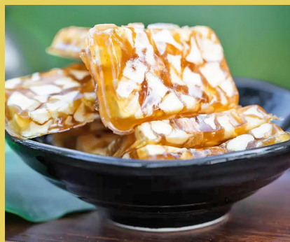
【初草堂雪梨枇杷糕】 地道食材 口感软糯 滋养咽喉 16袋/盒 小晚价：59元/盒 118元/3盒(买2送1) 177元/3盒(买3送2)

春天到了，万物复苏，百花齐放，一切都充满了生机，我们的舌尖也和万物一起被唤醒。小晚奉上好物，与君共尝春之味！