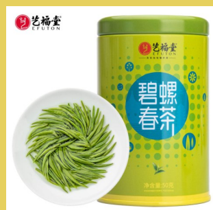
【艺福堂 明前碧螺春】 金螺韵EFU12+ 尝鲜装 2021 新茶 50g/罐 小晚价：69元/罐