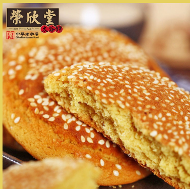
【中华老字号 荣欣堂太谷饼】 整箱 1500克 小晚价：29.9元