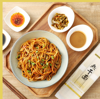
【武汉热干面】 10分钟做好一碗地道武汉热干面 6人份小晚价：

900g*1盒(6人份,赠送6包酸豆角) 33.8元 900g*2盒(4包,赠送酸豆角) 59元 900g*3盒(6包,赠送酸豆角) 89元