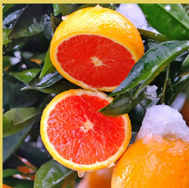
【中华红血橙 秭归脐橙】 自家果园橙子，不打蜡不上色 小晚价：5斤装 35.9元/箱 9斤装 59.9元/箱

900g*1盒(6人份,赠送6包酸豆角) 33.8元 900g*2盒(4包,赠送酸豆角) 59元 900g*3盒(6包,赠送酸豆角) 89元