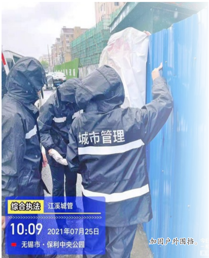
综合执法 江溪城管 10:09 2021年07月25日 无锡市·保利中央公园 加固户外围挡。