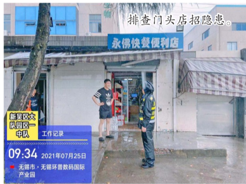
排查门头店招隐患。 新吴区公园一队一中队 工作记录 09:34 2021年07月25日 无锡市·无锡环晋数码国际产业园

为积极应对台风“烟花”带来的恶劣天气,做好防台防汛工作,保障人民群众生命财产安全,新吴区城管部门未雨绸缪,提前部署,积极应战,第一时间全面落实各项安全防范措施,全力筑牢了汛期城市运行安全屏障。值得一提的是,台风“烟花”来临前夕,新吴区一万一千多个沿街店铺及户外广告店家收到了温馨提示,这是新吴区城管局智慧城管系统在防汛抢险指挥中的全新应用,对于安全应对恶劣天气发挥了很好的作用。