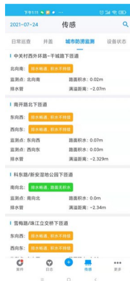
低洼水位及雨水管网传感器警示信息。

警;当前,引入慧眼360监控平台、智慧“721”系统及新吴区“一张图”等智能化平台,开展友情提醒、抢险指挥、精准调度。在2020年,还在全区首次绘制了积水地图,供相关部门及各街道决策使用;未来,将建设统一的数据中间池及可视化指挥调度平台,加强智慧城管平台中各系统间的数据关联,提高大数据分析能力,提升指挥调度的及时性与准确性,进一步满足日常工作及应急情况下的需求。(忠兰)