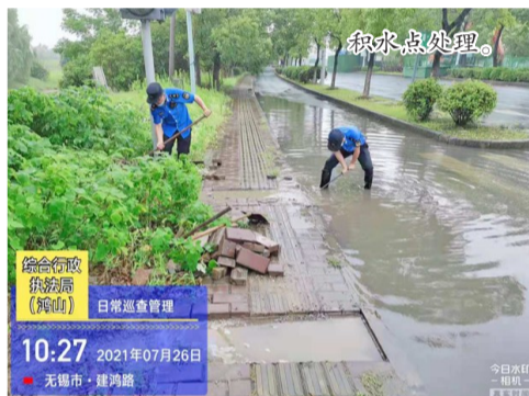
积水点处理。 综合执法 执法员 (梅山) 日常巡查管理 10:27 2021年07月26日 无锡市·建鸿路