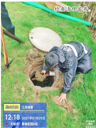
检查清理窨井。 综合执法 江溪城管 12:18 2021年07月25日 无锡市·春城家园A区

7月23日,高新区(新吴区)城管局第一时间召开党组会议,要求各处室、部门按照应急预案靠高一档、跨前一步抓细抓实各项防范应对工作。市政、环卫、绿化等行业主管部门分别召开作业单位会议,对各行业领域的防范任务和应对措施进行了具体部署。同时,新吴城管各行业领域共落实防汛应急队伍49支、人员近700人、大型排涝泵车2辆、小型应急排涝车23辆、工作车辆140辆、排水泵30余台、草包5000只、蛇皮袋5000只、警示墩50只。严格执行24小时值班制度和领导带班制度,确保人员沟通和信息报送渠道通畅,一旦发生险情及时、科学、高效进行处置。