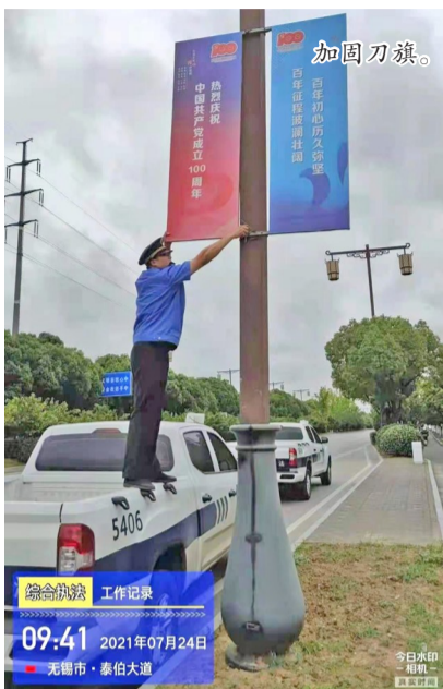
加固刀旗。 综合执法 工作记录 09:41 2021年07月24日 无锡市·泰伯大道

门盖板进行检查,保障夜间照明功能。新吴区城管执法大队平均每天出动500多人次,车辆120多辆,重点对机场路高架、红旗路沿线、梅里农贸市场、南星苑涵洞、梅西桥下涵洞、长江路连接线等低洼易积水区域进行全面巡查,对辖区内长江北路、新华路、鸿运路沿线,硕放商城周边等重点区域的工地围挡、广告牌进行检查,及时加固围挡、清理倒伏树枝、清除道路积水。