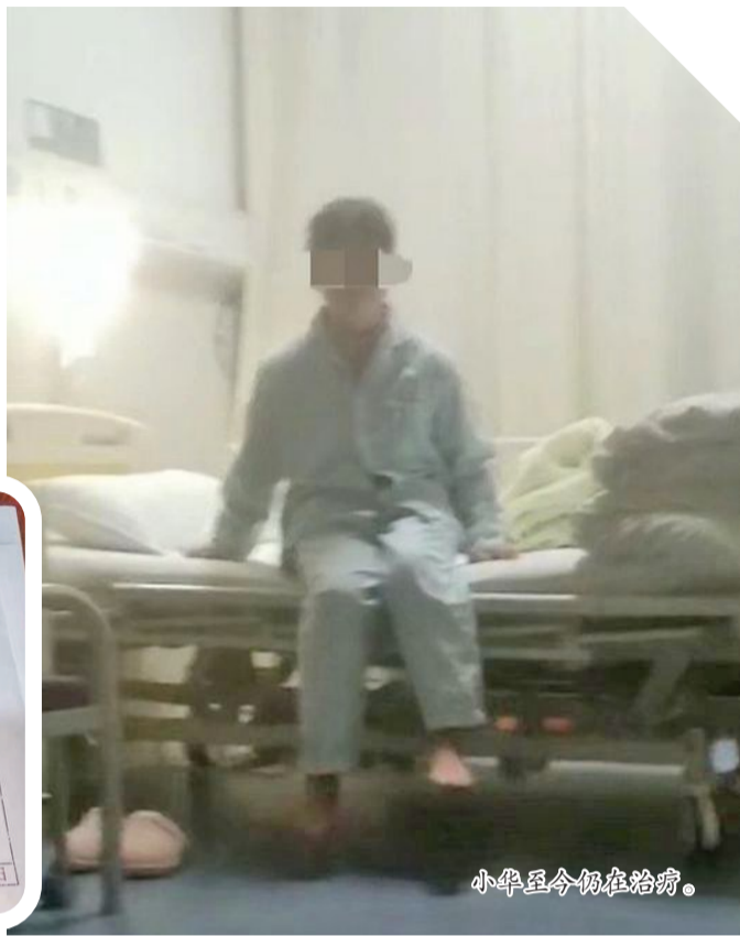
小华至今仍在学习。