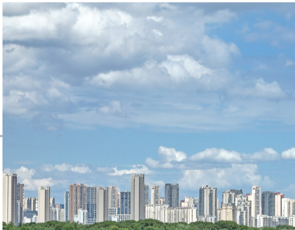
锡城雨季即将来临，昨天锡城天际出现了大片云朵，好似置身于漫画中。