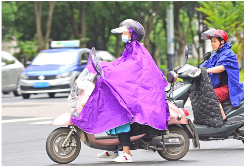
无锡市6月23日入梅，当天早晨，市民在海滨城附近一处路口冒着细雨出行。（还月亮摄）