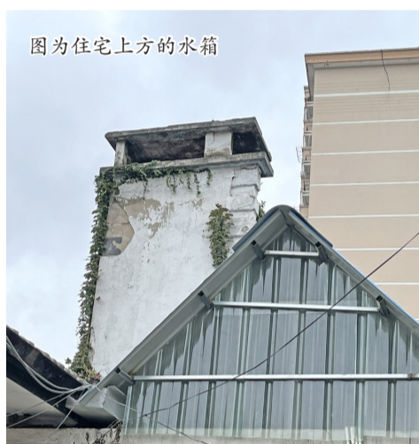
图为住宅上方的水箱