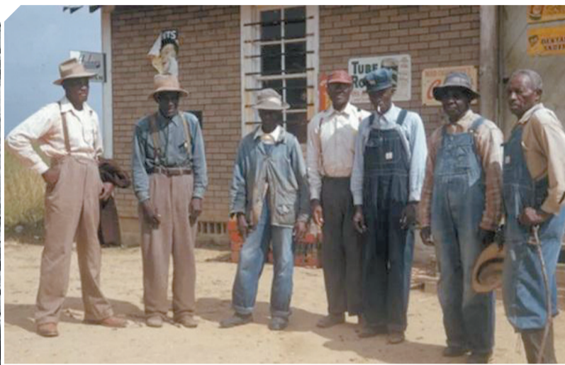
参与美国塔斯基吉梅毒实验的非洲裔人员。图片来源：美国国家档案馆。