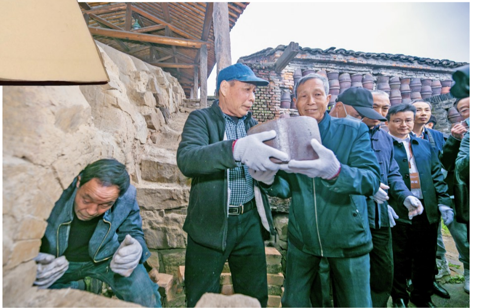
▲昨日,前墅龙窑国际柴烧艺术节开幕。