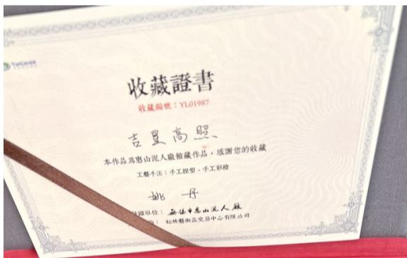
▼江苏省老字号“三进三促”无锡站老字号市集上展销的泥人阿福。