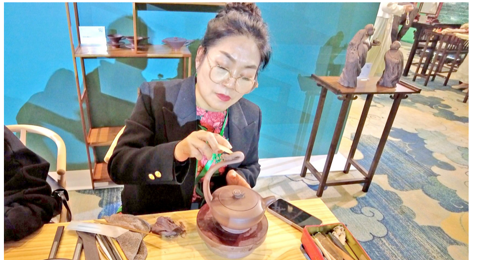
▼长三角三省一市省级以上非遗项目展上的紫砂制作展示。