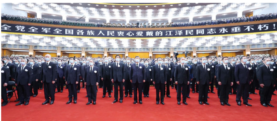
习近平、李克强、栗战书、汪洋、李强、赵乐际、王沪宁、韩正、蔡奇、丁薛祥、李希、王岐山等参加大会。