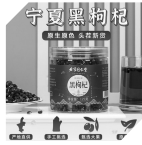
北京同仁堂黑枸杞

125g/罐 无染色无硫熏 颗颗黑亮饱满 小晚价:1罐装 49.9元 2罐装 84.9元