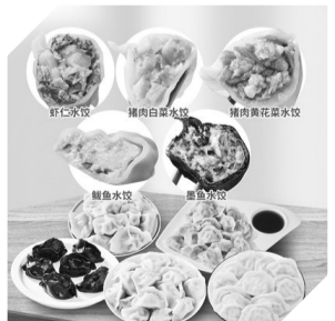
泰祥速冻水饺组合

冬阴功汤底/金汤花胶鸡汤底 /番茄汤底/胡椒猪肚鸡汤底 /菌菇汤底 小晚价:5盒装 49.9元