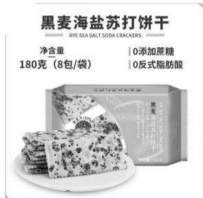
黑麦海盐苏打饼干