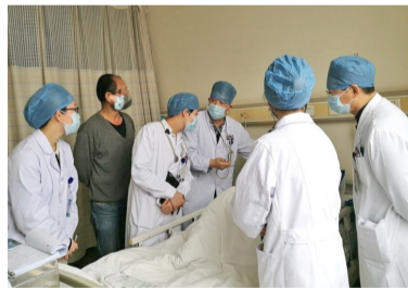
临床药师参与临床查房