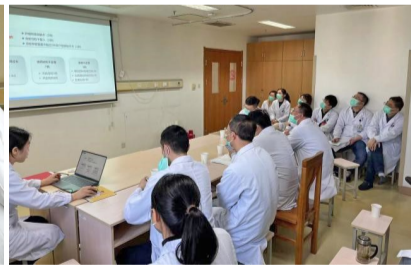
临床药师开展药事查房

药学部现有16名临床药师,日常参与心内、心外、呼吸、消化、神内、妇产、肿瘤、普外、重症医学等临床科室的药物治疗工作,配合医生制定药物治疗方案、协助护士优化给药方式,对患者开展个体化用药监护、实施合理用药宣教等;积极为临床科室的合理用药出谋划策,协助解决多重耐药患者的抗菌药物调整、肝肾功能不全患者的药物选择及发生ADR的替代治疗等问题,年会诊500余例;通过医生+药师的双联系人制度,加强临床科室日常用药监测与反馈,探索了一条崭新的合理用药管理之路。