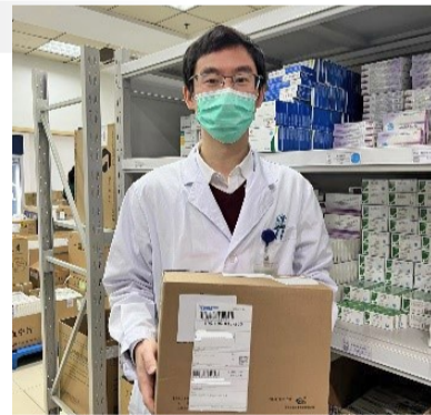
互联网医院处方调配

在当前疫情形势下,为方便患者足不出户即可看医生、开处方,针对需要长期开药的慢病复诊患者,我院在2022年初开设了互联网医院,门诊药房同步启动药品物流配送服务。医生经在线门诊诊疗、开具相应医嘱后,系统生成对应的电子处方单,电子处方单经审方中心审核通过后,流转至门诊药房由药师进行调配、核对,并联系物流公司进行配送,为足不出户的患者提供了很大的方便。