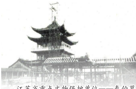
江苏省重点文物保护单位——泰伯墓 修扩建工程总投资达1500万元。

无锡是“吴文化”的发源地，也是一座拥有着三千年历史的文化名城。文化新闻报道能从多种角度为市民提供共享平台，探讨城市生活的无限想象与可能。从上世纪90年代末抢先撰写了《巍巍名人墓群首次“浮出水面”》到今年独家报道《失踪百余年后归来！无锡惠山“九龙”终聚首》；从王彬彬在1997年将《珍珠塔》复排首演一炮打响到《“彬彬腔”第三代登台亮相》；三十年时间里，江南晚报始终坚持做有温度有深度、吸引人打动人、传得开传得远的文化报道。