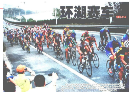
2010“灵山杯”环太湖国际公路自行车赛在美丽的太湖之滨无锡举行。图为职业组车队通过十八湾。