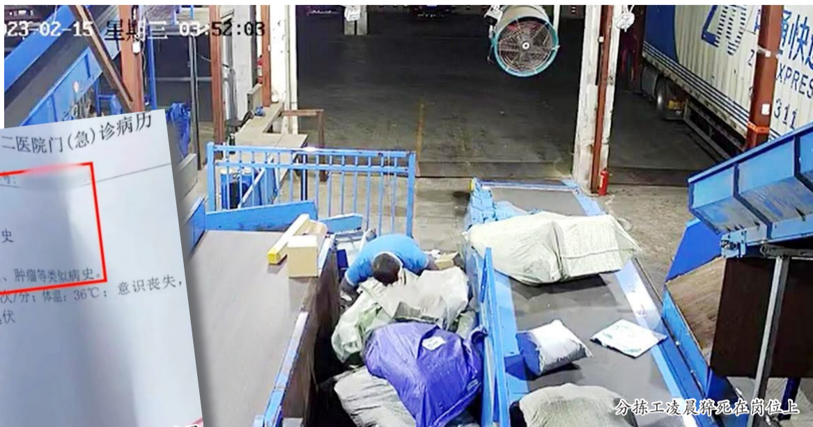
分拣工凌晨猝死在岗位上