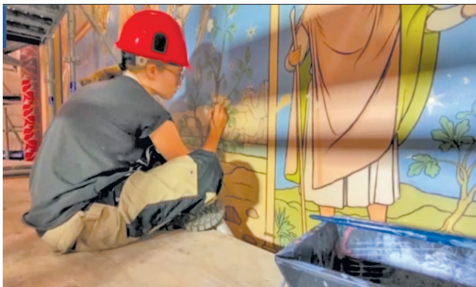
工匠正在修复内部装饰画。

巴黎圣母院始建于1163年，是巴黎最负盛名的古迹之一，也是著名的世界文化遗产。火灾之前，这里每年都会接待近1300万人次游客。据悉，法国为修复大教堂筹集了至少10亿欧元。巴黎圣母院公共修复机构表示，在今年春天，火灾中被损毁的塔尖框架将率先完成重建。预计在重新开放后，每年的参观人数将达到1500万人。（中新）