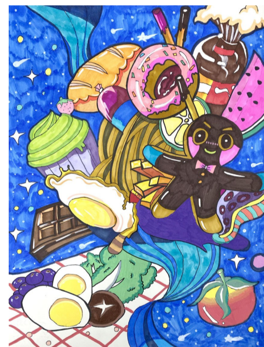
东林古运河小学一1班 锡报小记者 席小寒