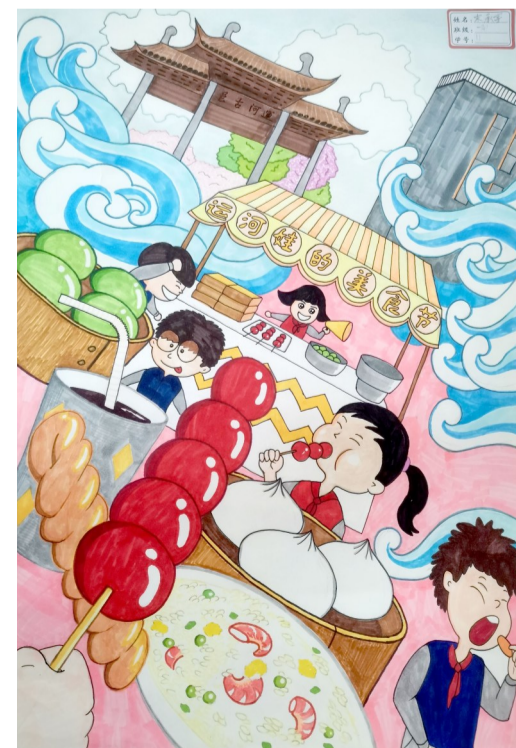
东林古运河小学一4班 锡报小记者 宋承宇