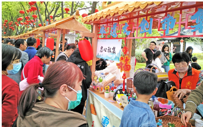
“惠心雅集”活动现场。

近年来，惠山区残联依托残疾人之家作为就业和创业孵化基地，针对残疾人特长，寻找和开发各类合适的产品，组团参加商业集市、文化节活动，以“惠心雅集”统一冠名，通过宣传推广、市场营销，社会知名度和影响力不断扩大，将惠山残疾人自主产品转化成“网红”品牌，帮助更多残疾人通过劳动实现就业梦想，促进残疾人增收致富。