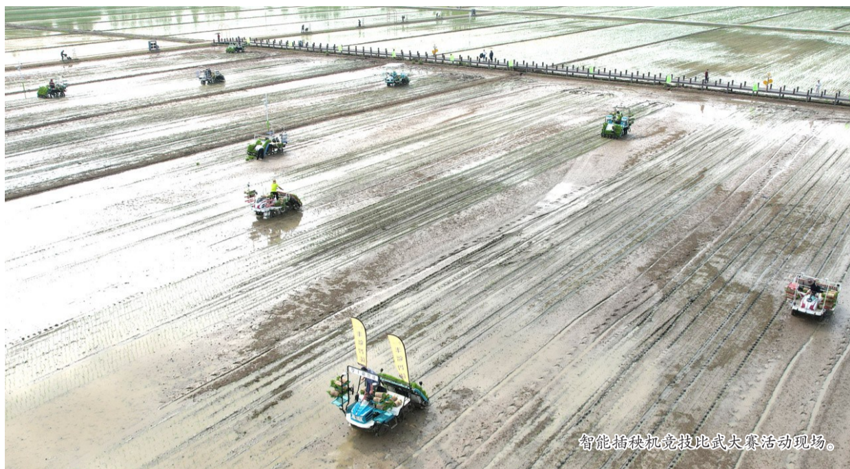
智能插秧机竞技比武大赛活动现场。

活动现场，省农业农村厅授予无锡市“江苏省农机数字化先行市”，授予锡山区严家桥农机专业合作社“江苏省智能农机比武（严家桥）基地”称号。此外，江阴市林度农业服务专业合作社、宜兴市金兰农业服务专业合作社、无锡市严家桥农机专业合作社等10家合作社被授予“无锡市首批