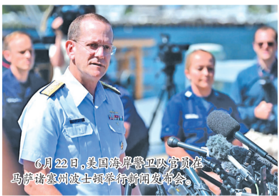
6月22日,美国海岸警卫队官员在马萨诸塞州波士顿举行新闻发布会。

美国媒体披露,“泰坦”号下潜当天,美国海军侦听到水下声响,可能是“泰坦”号“内爆”的声音。