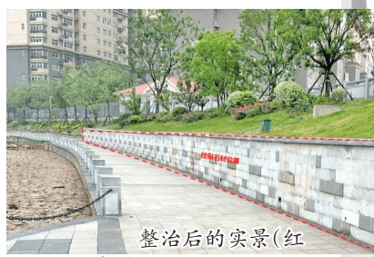
整治后的实景(红色虚线内为挂贴石材位置)。