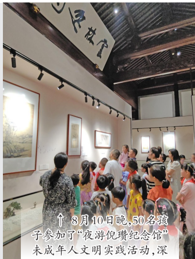
↑ 8月10日晚,50名孩子参加了“夜游倪瓒纪念馆”未成年人文明实践活动,深入了解本地历史文化。

7月以来,锡山区依托新时代文明实践中心(所、站)及特色街区、公园、街巷等市民喜爱的夜间公共文化场所,积极探索传承与文明传播的融合路径,有序开展夜间文明实践活动,“左邻右里Yeah起来”塑造融文艺演出、文化体验、志愿服务等为一体的文明实践夜市品牌,各类夜讲、夜观、夜演、夜市文明实践活动串珠成链,内容丰富的“夜间模式”形成精彩文明动线。