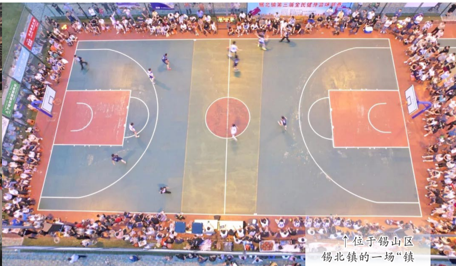
↑ 位于锡山区锡北镇的一场“镇BA”篮球赛事。