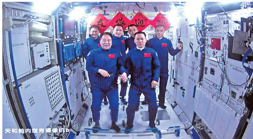
10月26日在北京航天飞行控制中心拍摄的神舟十七号航天员乘组和神舟十六号航天员乘组“全家福”。

神舟十七号是我国载人航天工程进入空间站应用与发展阶段的第二次载人飞行任务,此次发射正值我国首次载人飞行任务成功20周年之际,20年来我国载人航天工程发射任务实现30战30捷。本次任务有哪些看点?新任乘组“太空出差”干些啥?