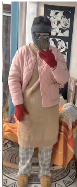
“因为上班穿得恶心被领导叫去谈话”的视频博主也有精致穿搭。(视频截图)