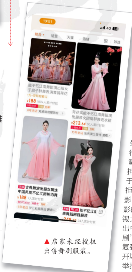
▲店家未经授权出售舞剧服装。

需要注意的是，侵害知识产权并不一定仅承担民事赔偿责任。根据《中华人民共和国刑法》第二百一十七条规定，侵犯著作权罪，是指以营利为目的，未经著作权人许可复制发行其文字、音像、计算机软件等作品，出版他人享有独占版权的图书，未经制作者许可复制发行其制作的音像制品，制作、展览假冒他人署名的美术作品，违法所得数额较大或者有其他严重情节的行为。