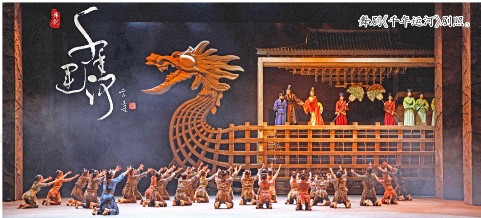
舞剧《千年运河》剧照。