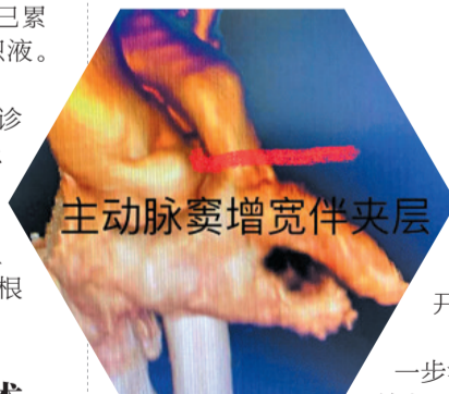
主动脉窦增宽伴夹层