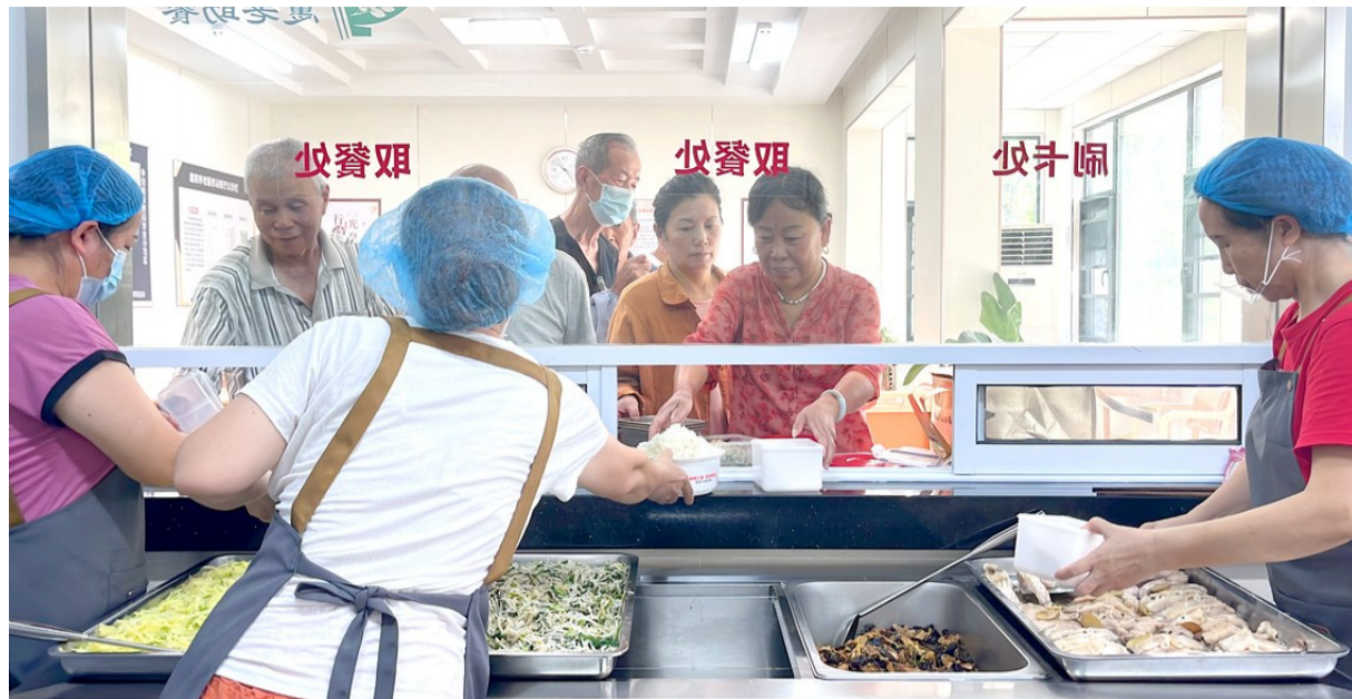
谈村幸福餐厅的午间打饭情景。

近日，无锡第二批共157家助餐场所公布，这些新增的点位为老年人提供了远离厨房油烟、享受清凉用餐的“乐土”。日前，记者走进助餐厨房、餐厅和市民家中，了解不同模式的“锡心香伴”惠老助餐工程在夏日里给老年生活带来的变化。