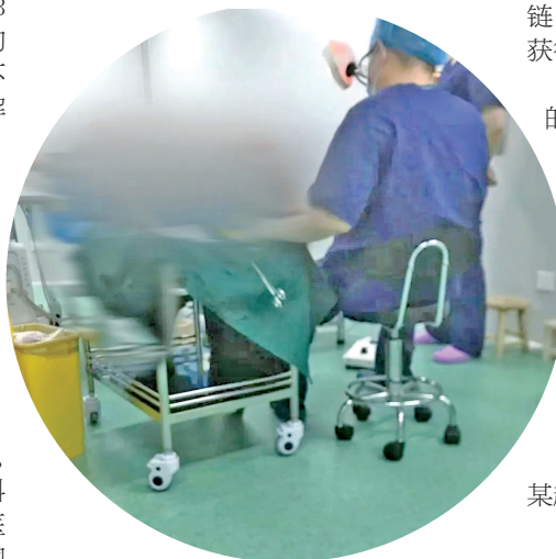
地下代孕实验室手术现场