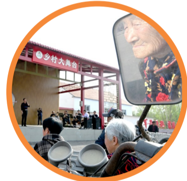
阳信县乡村大舞台