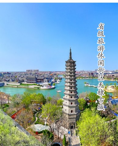
省级旅游休闲街区无棣古城