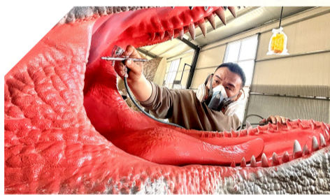
海百合用三维科技复原古生物模型