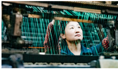
惠民县李庄镇已经发展为全国最大的绳网生产集群