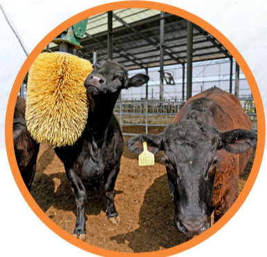
阳信县亿利源打造了全国第一家5G牧场