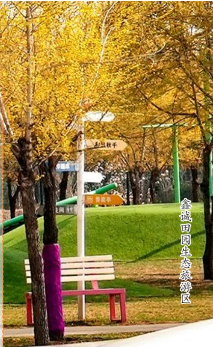
鑫诚田园生态旅游园