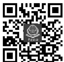
增值税发票管理系统 停机升级通告

航信咨询热线：95113 百旺咨询热线：025-83338448 4006112366 中润四方咨询热线：4008282933