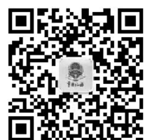
无锡税务微信公众号