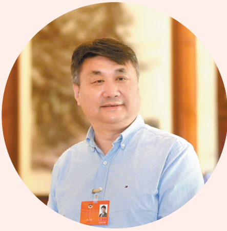
唐江澎 全国政协委员、江苏省锡山高级中学校长