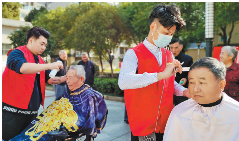
秋风送爽,又逢重阳。10月20日,梅村街道泰伯三社区党委携手梅村卡丝美容美发开展“情暖重阳、义务理发”志愿服务活动。40多名社区居民接受了义务理发志愿服务,大家对社区在重阳节之前安排的暖心服务纷纷点赞。